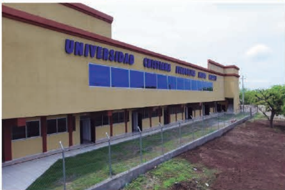
Campus San Lorenzo