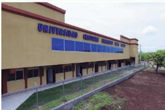
Campus San Lorenzo